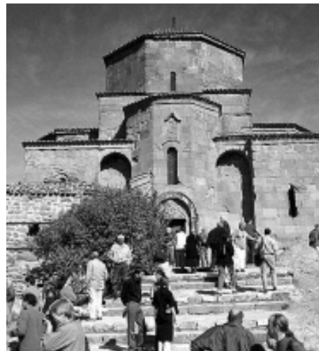
ჯვარი პატიოსანი ამკვიდრებს ლიტურგიულ ცნობიერებას, რომ მაცხოვრებელი ვნება მარად თანამდევია.

ზემოთ. იოანე წინამორბედზე მალა, მოციქულზეზე ზემოთ და მალა წინასწარმეტყველებსა და წმინდანზეზე. ეს ამაღლებული არსება არის სახე და გამომხატველი მთელი ქვეყნიერებისა. (პ.ფლორენსკი) ჯვრის ძალამ დაამსხვრია არმაზი. არის ჯვარი ქრისტესი და არის ჯვარი ჩვენებისა, რომელსაც ისევე უნდა განვიცდიდეთ, როგორც მაცხოვარი ამბობს: „უღვრელი ჩემი ტკბილ არს და ტვირთი ჩემი სუბუქ არს. (მთ.11,30) და ეს იმიტომ, რომ ჯვარცმისას ჯვარს ეცვა მაცხოვარი თავისი ადამიანური ბუნებით. მისი ღვთაებრივი ბუნება კი არ ვნებულა, ამით მან გამოიხსნა ადამისეული ცოდვა ჩვენში, ამიტომ გვაზიარებს ჩვენც ღვთაებრიობას. ჯვარი აერთებს და აკავშირებს ჩვენში ადამიანურს და ღვთაებრივს. მაცხოვარია ჯვარი პატიოსანი და მაცხოვარია სვეტიცხოველი, რომლის უძველესი იერსახე ის ნათლის სვეტია, უდაბნოში რომ მიუძღოდა ხალხს: „რომელს პირველ ისრაელთა ზანაკსა უძღოდა უდაბნოს სვეტითა ცეცხლისათა და გრილობდა ღრუბლითა ნათლისათა, დღეს შვილთა მისთა დასაჯეს ჯვარსა ზედა და დაფარეს დაფლვითა საფლავთა შინა.