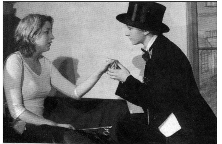
The Importance of Being Earnest: Probe des englischen Theater-Clubs im St. Ur- ula-Gymnasium.

— ბევრი არა. ამდენ საქმეს იქ ბავ- შვები არ აკეთებენ. ერთი კლასელი ბიჭი მყავს. ის კვირაში ორჯერ 3 იპოდრომზე დადის. დანარჩენ დროს სახლში ზის და ტელევიზორს უყუ- რებს. სულ რამდენიმე ბავშვია სა- აგენტოში. გვასწავლიან სიარულს, პო- ზირობას და ასე შემდეგ.