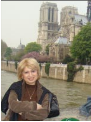
მატულ სიტუაციებს. ამით, ერთი მხრივ, ემიგრაციის სურვილით

და. მართალია, ფინანსური შესაძლებლობა ჯერჯერობით, მუშაობის უფრო გაფართოების საშუალებას არ იძლევა. მაგრამ იმედი გვაქვს, ეს ინტერესი, რაც ჩანართისა და გადაცემის მომზადებას მოჰყვება, მოიცავს არა მარტო იმას, ვისაც უშუალოდ ეხებათ ემიგრაციის სიმძიმე, თუ შედეგებითი ყოფით ცხოვრებაში, არამედ იმათაც, ვისაც ამ პრობლემის მოგვარებაში დახმარების შესაძლებლობა აქვს და სურვილიც, მისი საქმიანობის ფართოდ რეკლამირება მოახდინოს. ჩვენ კი გპირდებით, შეძლებისდაგვარად ჩვენთან ერთად გამოგზავნებთ უცხოეთში აღმოჩენილ „პატარა საქართველოებს“ - გაგაცნობთ მათ ყოფას, მოღვაწეობას, წარმატებებს და და-